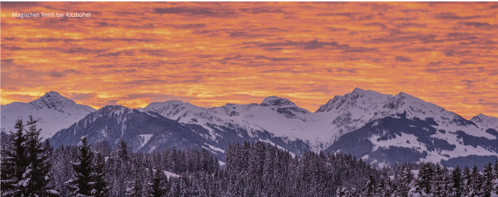
Magisches Reith bei Kitzbühel